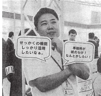
会場内の吹き出し型写真パネル

ITソリューション展示を行うコンベンションホールでは、「複合機・クラウド連携」「文書管理・データ変換」「Web会議システム」などのカテゴリで、ユーザーごとに課題解決を提案。さまざまな課題が、等身大の社員の吹き出し型写真パネルに吹き出し